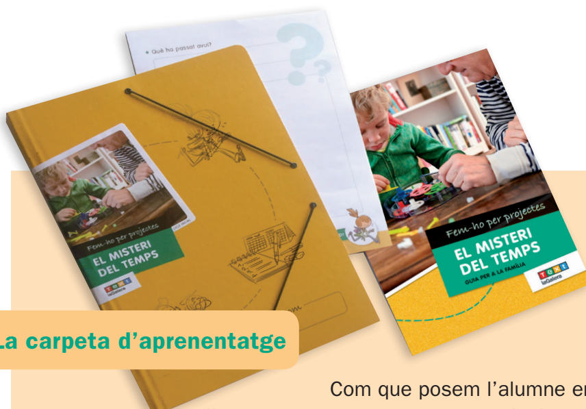
La carpeta d'aprenentatge

Com que posem l'alumne en el centre de l'aprenentatge, aprenent a aprendre i conscient del que aprèn i com ho aprèn, òbviament en la col·lecció " Fem-ho per projectes ", cada nen o nena ha de tenir el seu material individual i personalitzable.