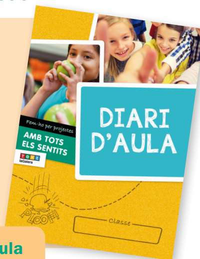
El diari d'aula