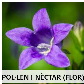
POL·LEN I NÈCTAR (FLOR)