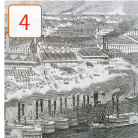
temps de les fàbriques