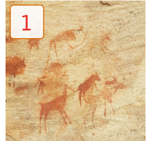
temps de les coves

2 Llegeix aquesta notícia i contesta: Respostes model: