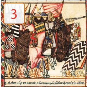
temps dels castells

1 Escribe de quin temps són aquestes imatges i numera-les de la més antiga a la més moderna: